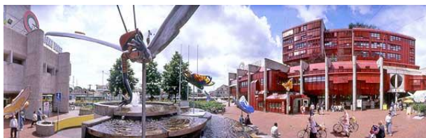
Aufgangrondelle der Unterführung beim Brunnen (Blick Richtung Bahnhof).

Moser Optik AG Neumarktplatz 5201 Brugg/AG Tel 056 441 01 50 Natel 079 446 68 42